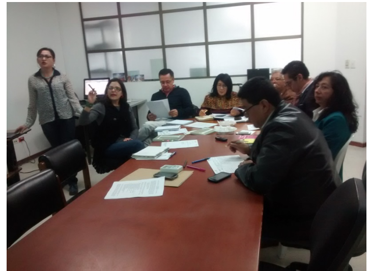
Sesión del Consejo Departamental de Patrimonio

Por otra parte se desarrollaron dos (2) reuniones con los responsables Museos del Departamento, buscando la articulación de los mismos y provocando el diálogo y la reflexión sobre su papel dentro de la dinamización de estos espacios patrimoniales. Como resultado de estas reuniones surgió un acuerdo fundamental, la construcción conjunta de un proyecto de fortalecimiento de la Red Departamental de Museos que garantice la difusión de la oferta que los Museos ofrecen.