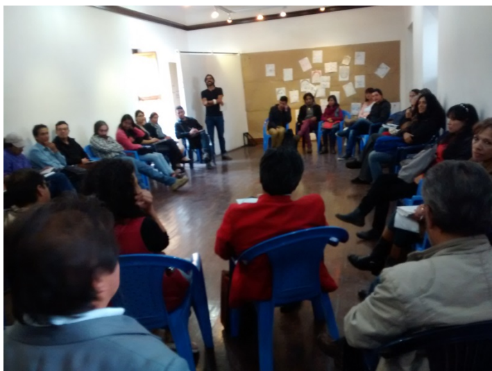
Aspectos de una de las reuniones del sector de Artes Visuales y Plásticas.

artistas, cultores, gestores culturales alrededor de las artes plásticas y visuales en Nariño, con un principio territorial y de inclusión de procesos de todo el departamento. Se adelantó también la construcción de directrices para la consolidación de un proceso continuo de articulación y diálogo del área.